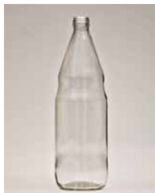
Proizvod: Boca za sirupe 1 l, Ultra Vlasnik proizvoda: Vetropack Straža tvornica stakla d.d., Hum na Sutli Proizvođač ambalaže: Vetropack Straža tvornica stakla d.d., Hum na Sutli