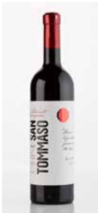
Proizvod: Crno vrhunsko suho vino "San Tommaso" Vlasnik proizvoda: San Tommaso, Rovinj Dizajn: D. Bruketa, N. Žinić, N. Cvetković, V. Đurašin, R. Radičević, A. Šutić, Bruketa&Žinić, Zagreb Proizvođač ambalaže: Valenari, Italija; Etigraf d.o.o., Sveti Petar u Šumi