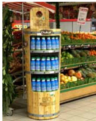
Stalak: Dukat stalak za BIO mlijeko Vlasnik stalka: Dukat mliječna industrija d.d., Zagreb Dizajn: Dizajn realiziran prema ideji naručitelja Proizvođač stalka: Signum Max d.o.o., Zaprešić