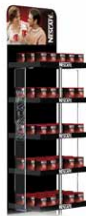
Stalak: Nescafe Premium Vlasnik stalka: Nestle Adriatic d.o.o., Zagreb Dizajn: Zlatko Lisac, Ajmo d.o.o., Zagreb Proizvođač stalka: Ajmo d.o.o., Zagreb