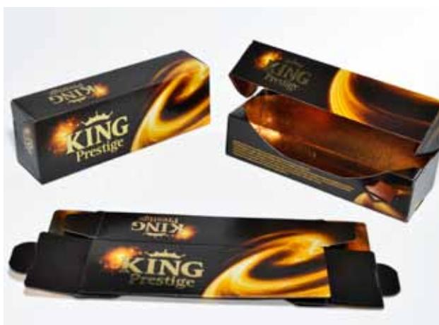
Proizvod: King Prestige - kutija za sladoled Vlasnik proizvoda: Frikom A.D., Beograd Dizajn: Zoran Švraka, Istragrafika d.d., Kanfanar Proizvođač ambalaže: Istragrafika d.d., Kanfanar