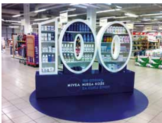
Otok: Nivea 100 godina Vlasnik otoka: Beiersdorf d.o.o., Zagreb Dizajn: Andrej Plahtan, Signum Max d.o.o., Zaprešić Proizvođač otoka: Signum Max d.o.o., Zaprešić