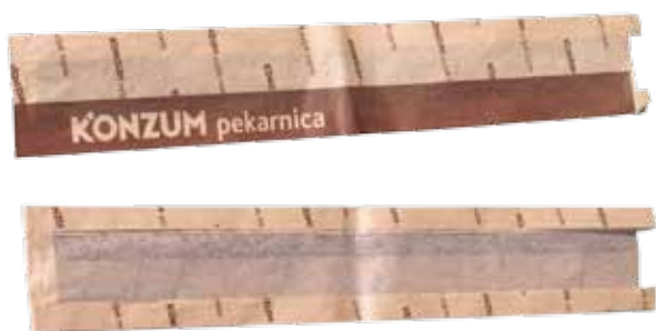
Proizvod: C Window Bag 90 XL N/1 Vlasnik proizvoda: Konzum d.d., Zagreb Dizajn: Miho Karoly, Kaligraf d.o.o., Zagreb Proizvođač ambalaže: C pakiranje d.o.o., Zagreb