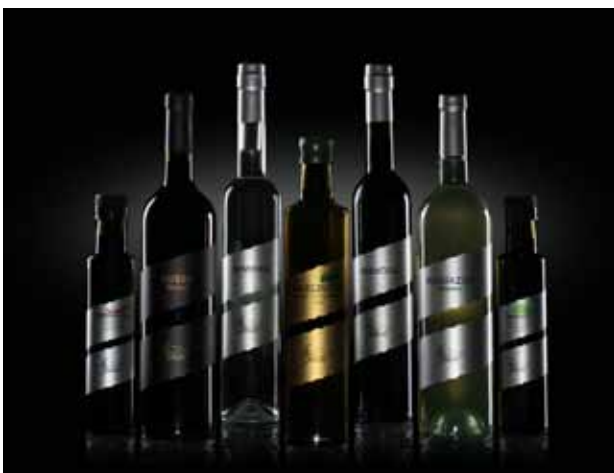
Serija: Jelušić wine, spirits&extra virgin olive oil Vlasnik serije: Jelušić wine and spirits, Opatija Dizajn: Emil Klontay, Heraklo koncept d.o.o., Zagreb Proizvođač ambalaže: Etikgraf d.o.o., Sveti Petar u Šumi