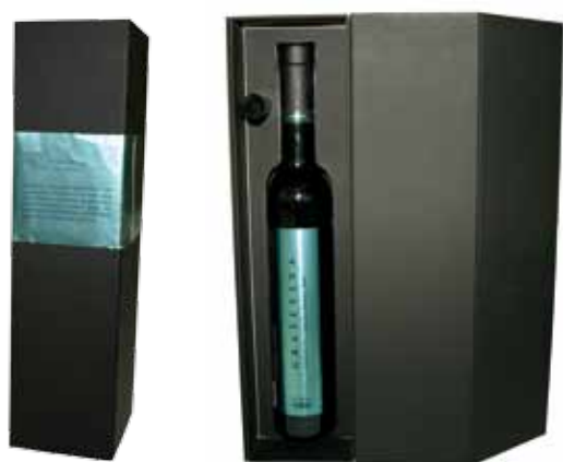
Proizvod: Graševina Ledena berba 2008 Vlasnik proizvoda: Kutjevo d.d., Kutjevo Dizajn: Sonja Stahor, Maja Stritof, Kadei, Zagreb Proizvođač ambalaže: Grafpex d.o.o., Zagreb; Markek d.o.o., Zagreb