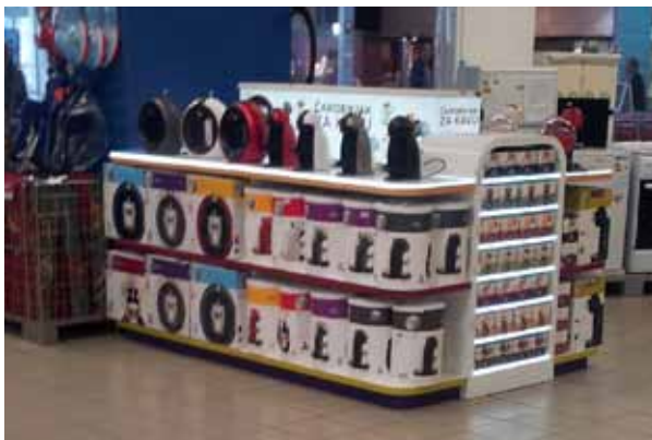
Otok: Dolce gusto "Shop in Shop" Vlasnik otoka: Nestle Adriatic d.o.o., Zagreb Dizajn: Imre Olah, Beflex, Mađarska Proizvođač otoka: Beflex, Mađarska