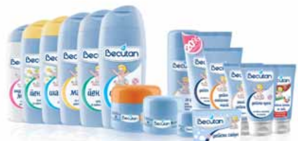
Serija: Becutan Collection Vlasnik serije: Alkaloid AD, Skopje Dizajn: Dragomir Lukin, Concept Marketing Communications d.o.o., Makedonija Proizvođač ambalaže: Umprom, Srbija; Stražaplastika, Hrvatska; Te Te Plast, Makedonija