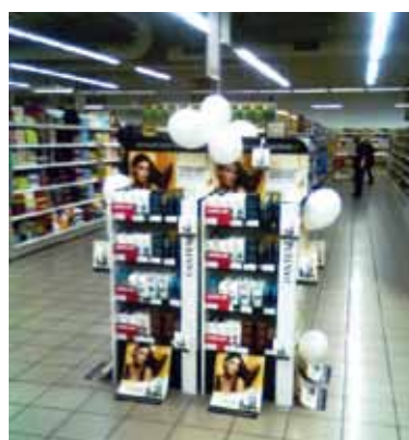
Otok: Novi look by Pantene Vlasnik otoka: Procter&Gamble d.o.o., Zagreb Dizajn: Josip Hrvoje Sučić, Procter&Gamble d.o.o., Zagreb Proizvođač otoka: Procter&Gamble za trgovinu d.o.o., Zagreb