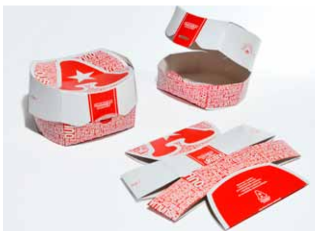
Proizvod: Kutija za mali sendvič Vlasnik proizvoda: American Donut d.o.o., Zagreb Dizajn: Roberta Jelčić, Istragrafika d.d., Kanfanar Proizvođač ambalaže: Istragrafika d.d., Kanfanar