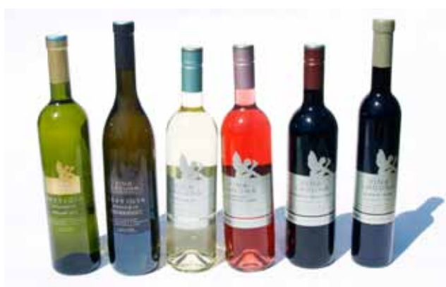
Seriya: Vina Laguna Malvazija, Rose, Cabernet Sauvignon, Muškat Ruža, Festigia Malvazija, Festigia Cabernet Sauvignon Riserva, Festigia Malvasia Riserva Vlasnik serije: Agrolaguna d.d., Poreč Dizajn: Lewis Moberly, London Proizvođač ambalaže: Vetropack Straža tvornica stakla d.d., Hum na Sutli; H.O.N-ing d.o.o., Sveti Križ Začretje