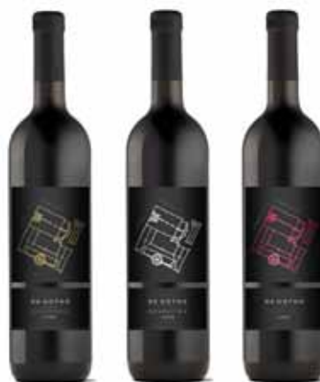
Seriya: De Gotha linija vina (Graševina, Pinot crni, Chardonnay) Vlasnik serije: Kutjevo d.d., Kutjevo Dizajn: Davor Papić, Maja Stritof; Kadei, Zagreb Proizvođač ambalaže: Brajkop d.o.o., Pazin