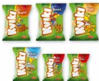
Nensi Benazić - rad 2