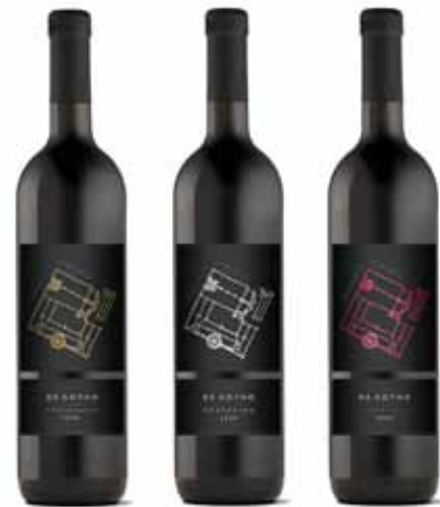
Serija: De Gottho linija vina Vlasnik serije: Kutjevo d.d., Kutjevo Dizajn: Davor Papić, Maja Stritof; Kadei, Zagreb Proizvođač ambalaže: Brajkop d.o.o., Pazin