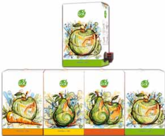
Serija: Serija proizvoda SOK Vlasnik serije: Ein Natural d.o.o., Sarajevo Dizajn: Amna Mahić Bajrović, Artico Studio d.o.o., BIH Proizvođač ambalaže: Ein Natural d.o.o., Sarajevo