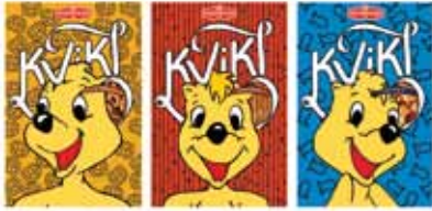
Zrinka Buljubašić – RAD 1