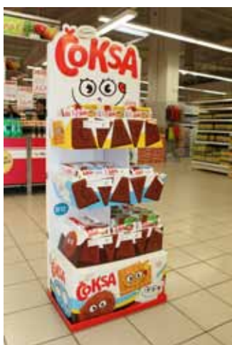
Stalak: Kraš Čoksa Vlasnik stalka: Kraš d.d., Zagreb Dizajn: Ana Belić, Bruketa&Žinić d.o.o., Zagreb Proizvođač stalka: Branaldi KFT, Mađarska