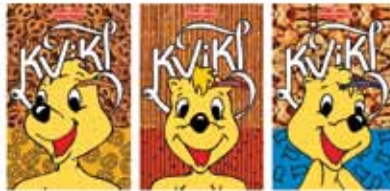
Zrinka Buljubašić – RAD 2