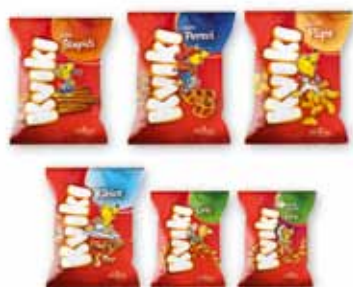
Nensi Benazić - rad 1