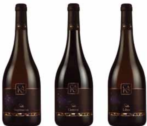
Seriya: Capo Stellae - Sagittarius, Libra i Gemini Vlasnik serije: Capo d.o.o., Brtonigla Dizajn: Jaša Zelmanović, Strka inovacije d.o.o., Zagreb Proizvođač ambalaže: Etikgraf d.o.o., Sveti Petar u Šumi